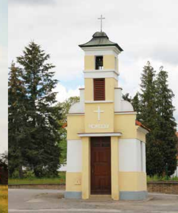
Kaple – Záblatí