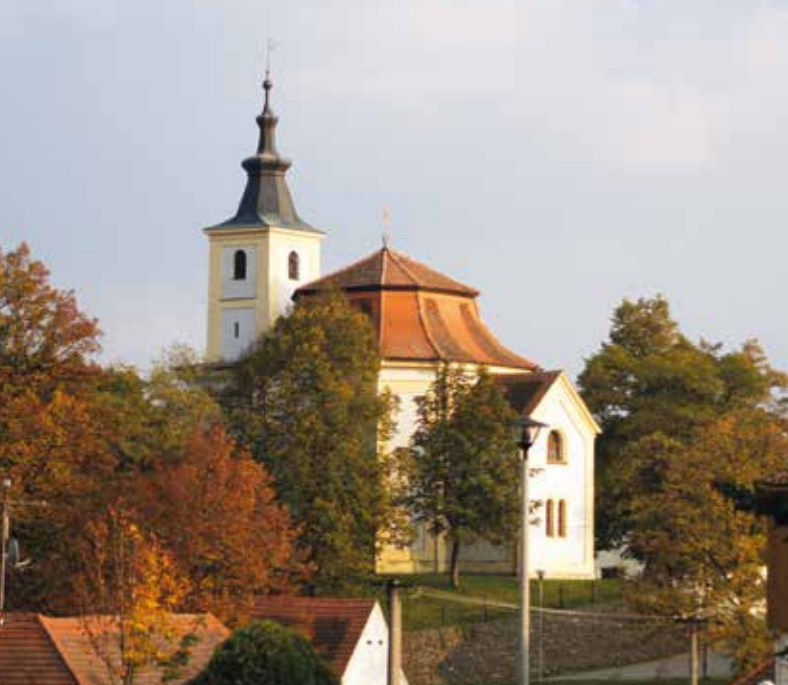
Kostel sv. Dismase ve Dřítěni