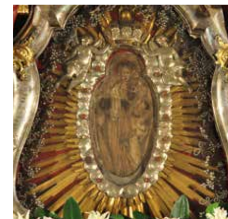
Obrázek Panny Marie, který našel Karel Bonaventura Buquoy po bitvě u Záblatí

Mezi Záblatičkem a Záblatím (dříve Velké Záblatí) stojí kříž na památku bitvy u Záblatí. Zde se v roce 1619 udála důležitá bitva třicetileté války, kdy tu bylo poraženo vojsko českých stavů vedené generálem Mansfeldem od habsburské armády císařského maršála Buquoye.