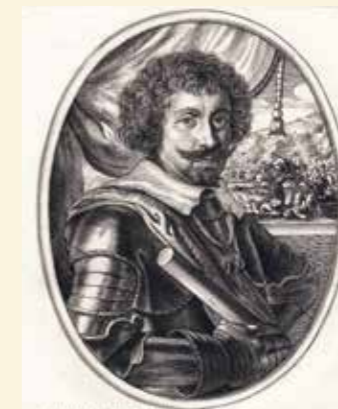
Karel Bonaventura de Longueval hrabě Buquoy (* 1571–† 1621), vrchní velitel císařské armády, 10. června 1619 porazil společně s Dampierrem Mansfelda u Zláblatí. Velel císařské armádě v bitvě na Bílé hoře 8. listopadu 1620. Zahynul v Uhrách při obléhání Nových Zámků.