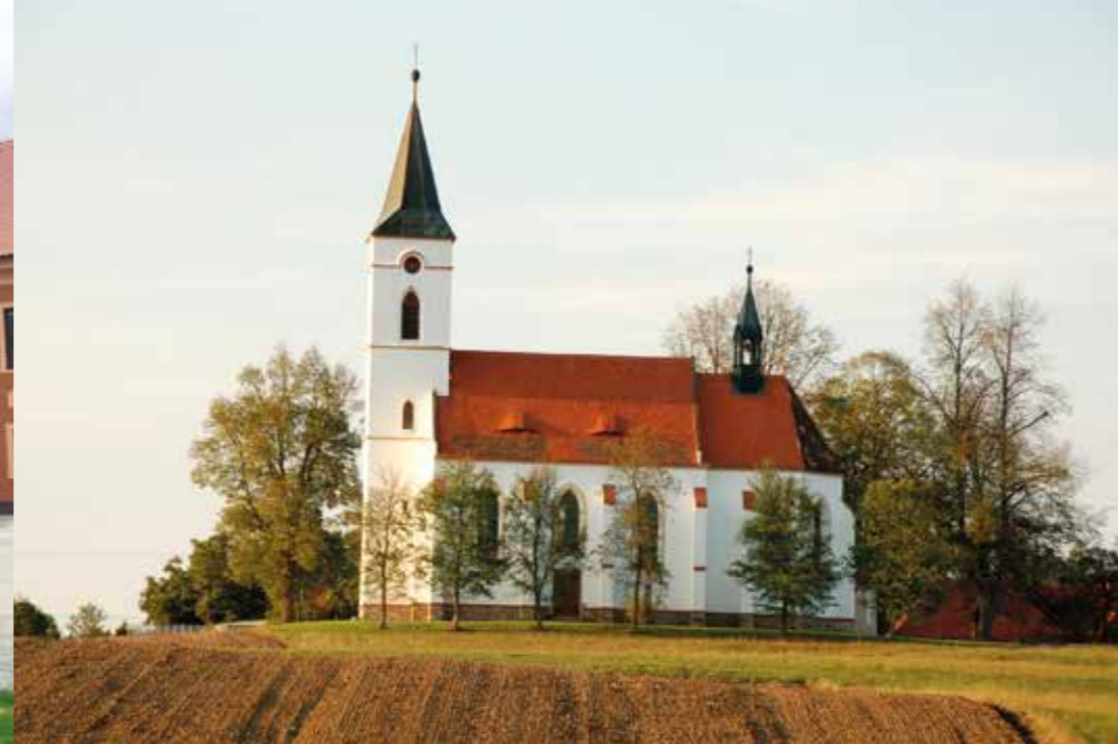
Kostel Panny Marie – Záblatičko, Foto: Zuzana Prokopová