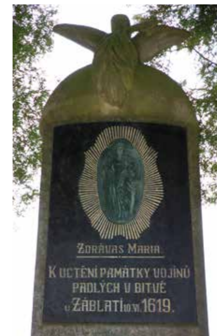
Reliéf Panny Marie na pomníku padlým spoluobčanům