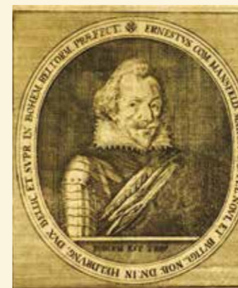
Petr Arnošt II. hrabě z Mansfeldu (* 1580–† 1626) v žoldu savojského vévody bojoval proti císaři na straně českých stavů. Dobil Plzeň, pokus o průnik k Českým Budějovicím skončil porážkou u Zláblatí 10. června 1619. Zemřel v dnešní Bosně při cestě z Uher do Benátek.

Thurn v období duben květen 1619 má za sebou tažení s desetitisícovým vojskem na Moravu. Po zpečetění paktu s moravskými stavy zahájil pochod na Vídeň a 6. června je na předměstích. Přání otcem myšlenky – co kdyby protestantská opozice otevřela bránu města... Posádka Vídně čítá asi 3 000 vojáků. Císař je krajně znepokojen. Thurn ostřeluje Hofburg z polních děl a mušket. Dělostřelectvu velí Kryštof Harant z Polžic a Bezdruzic (1564–1621). Škody jsou nepatrné, psychologické účinky značné.