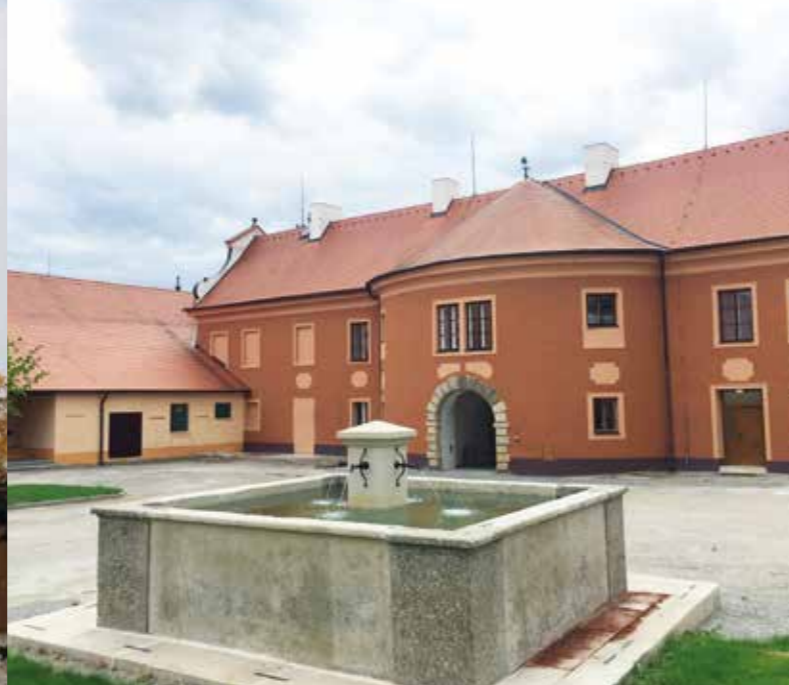
Dřiteňský zámek, Foto: archiv obce Dřiteň