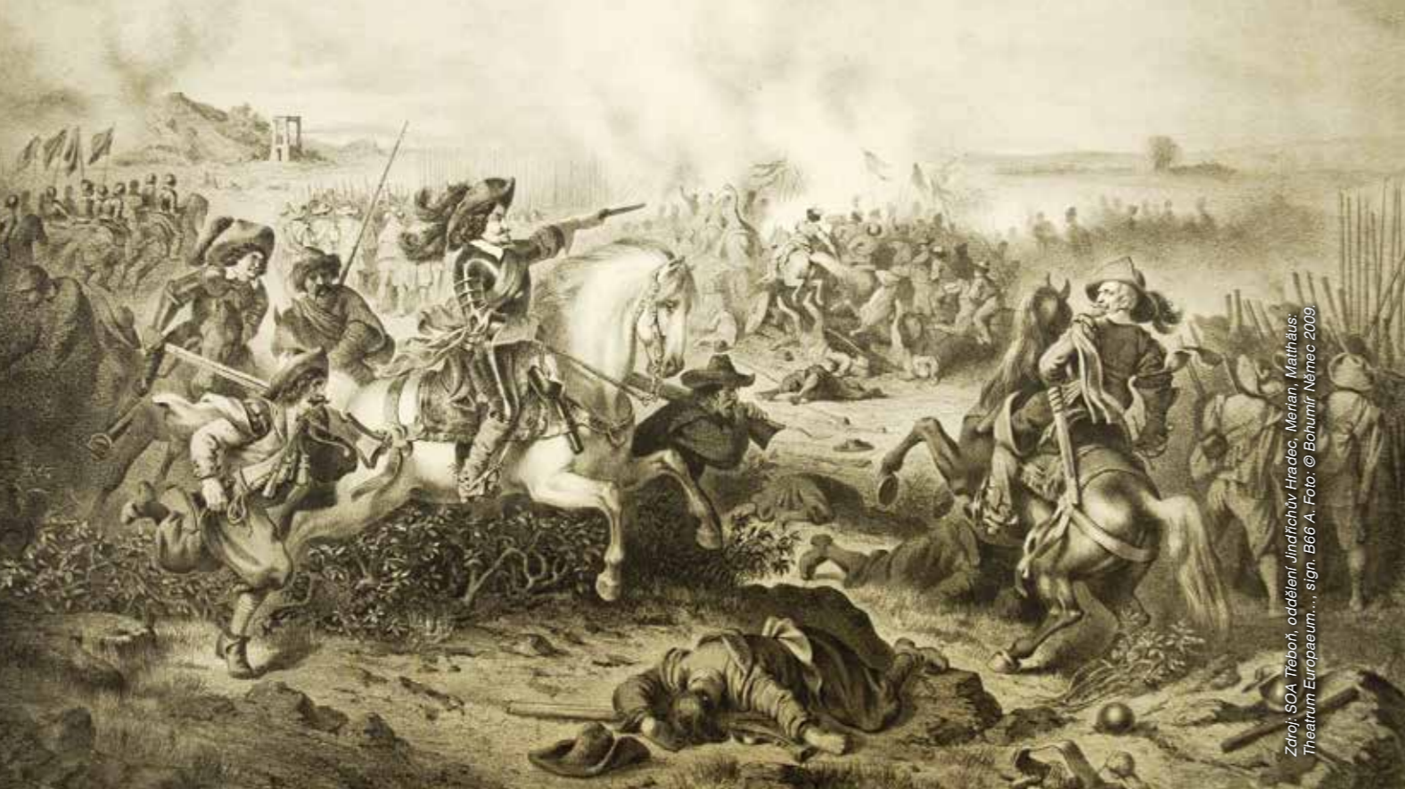
Bitva u Zláblatí 10. června 1619 na vyobrazení z 19. století, romantická představa o bitevní vřavě. V popředí s maršálskou holí na koni Karel Bonaventura hrabě Buquoy, vpravo rovněž v sedle koně Henri Duval hrabě de Dampierre.